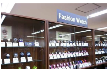
数百円～ブランドの腕時計まで