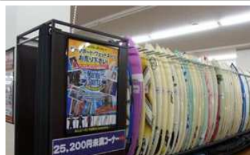
サーフボード、ゴルフ、野球、テニス等、スポーツ用品が一式