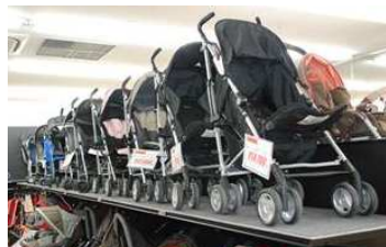
ベビーカー等子供用品も豊富