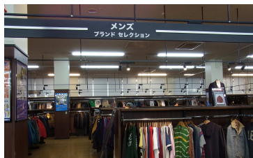
メンズ・レディース・子供服は人気ブランドからノンブランドまで