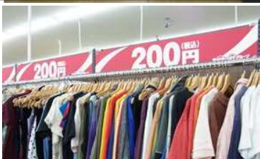
洋服の200円コーナー