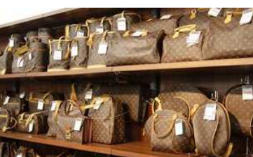
ブランドバッグコーナー