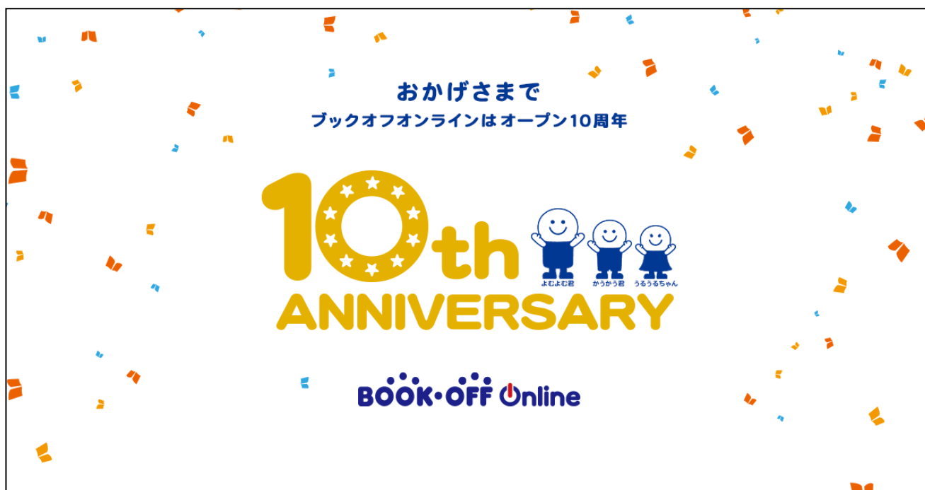
ブックオフオンライン 10周年特設ページ

■特設ページ http://www.bookoffonline.co.jp/files/lp/10th.html