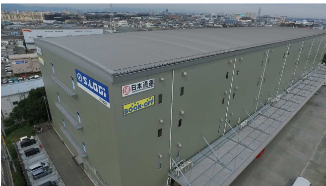
ブックオフオンライン事業所

ブックオフオンライントップページ: http://www.bookoffonline.co.jp/