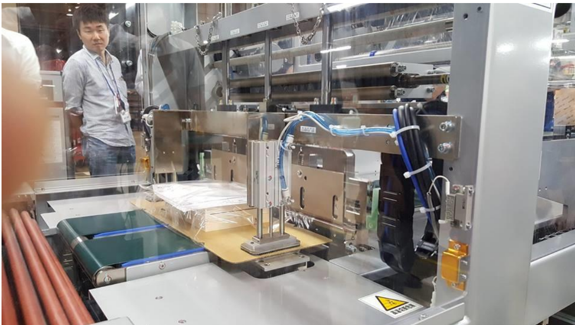
自動シュリンクによって緩衝材の必要量を効率化