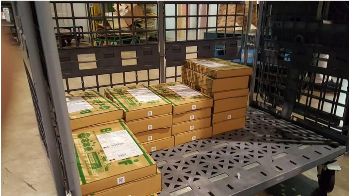
数種類の統一規格のダンボールにて丁寧に梱包し、トラック積載効率も改善